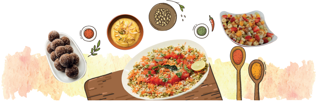
चित्र 6.7 - मेलारे ज़ोमाक् एमोक् लाहारे, गोटायमे ओना ज़ोमाक् दो सिबील होयोक्

ज़ोमाक् बेनाव तायोम नोआ कुकलीको रेयाक् ज़ोबाब एममे।