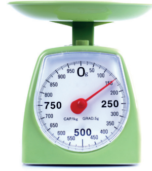
चितार 6.3- ओजोन

ओजोन (चितार 6.3) रेयाक् बेवहार काते नाप रेयाक् मित् कप, मित् चामोच, से लाटु चमोच (टेबलस्पून) रे तिनाक् जिनीस साहोप् दाड़ेयाक्आ। नोआ दो नापाय मात्रारे जिनीसको नापरे गोड़ोय एमोक्आ।