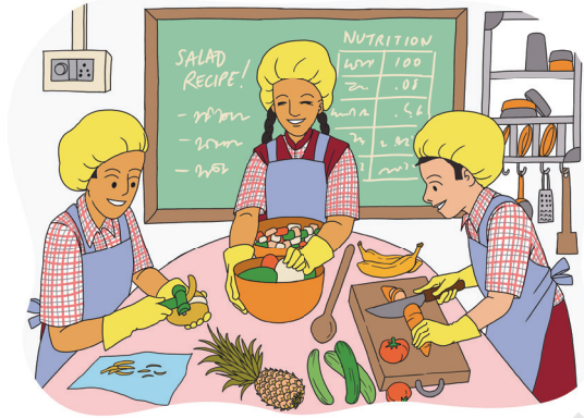
चितार 6.6 गेत् आर मिलाउ काते जोमाक् बेनाव

नितोक् दो जुय जिनिस बेनाव एना, तोबे आम नोडकान जोमाक् बेनाव एम एतोहोप् दाडैयाक्आ ओना गेत् आर मिलाउ लाकतीक् काना (चितार 6.6 जेलमे)। आम जोम लागित् बेनाव जो आर उतु जिनिस को गेत् आर सापड़ाव मे आर ओना बुलूड, नीबू रासा से मित् सिबील जोमाक् बेनाव लागित् एटाक् जिनिस को साँव मेसाल हुय दाडैयाक्आ।