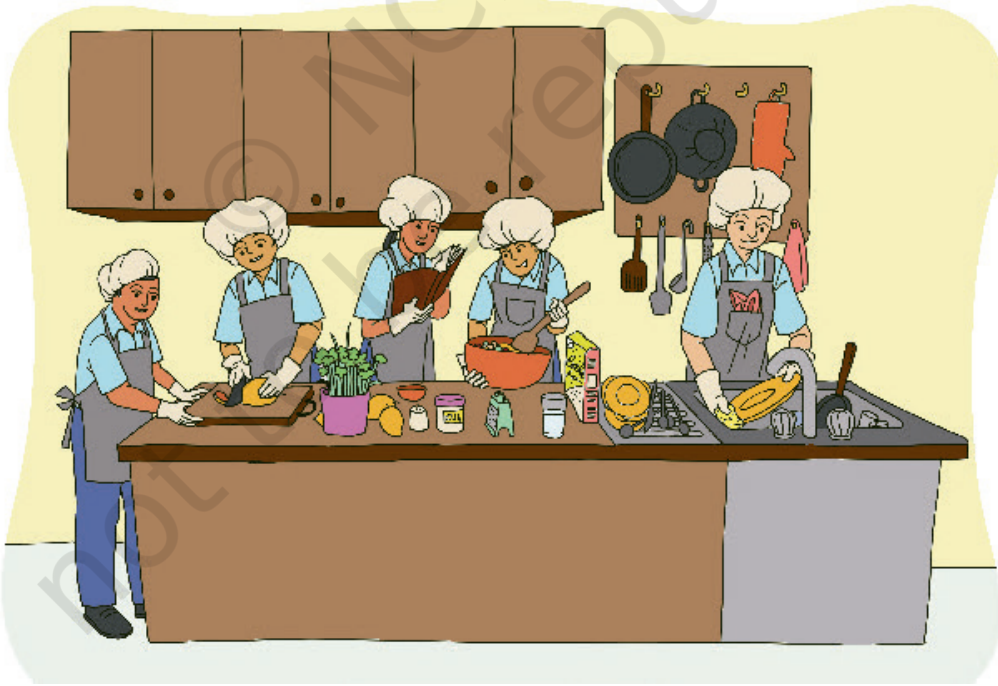
चि़तार 6.2 - दाकाय ओड़ोक् रे मित् साँवते कामी काना