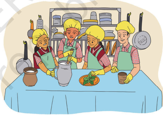
चिन्तार 6.5 - घोर बेनाव

जुवाक् जिनिसरे दाक् छाडा काते आरहों आयमा लेकान जुवाक् जिनिस सेलेत् होयोक्आ। नोआ रेयाक् पारतुलरे नीबू दाक्, घोर, जलजीरा आर कोकम सोरबोत मेसाल मेनाक्आ।